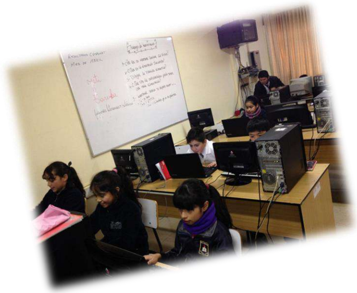
Sala de Computación