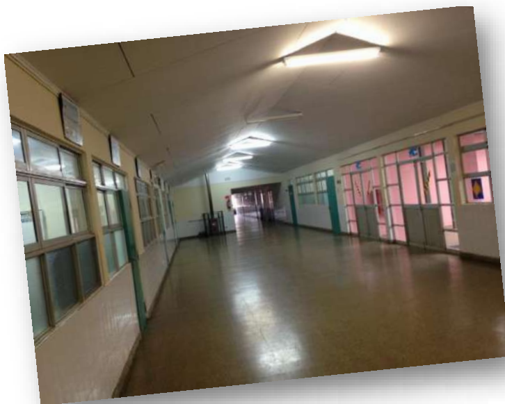
Hall y salas de Clases