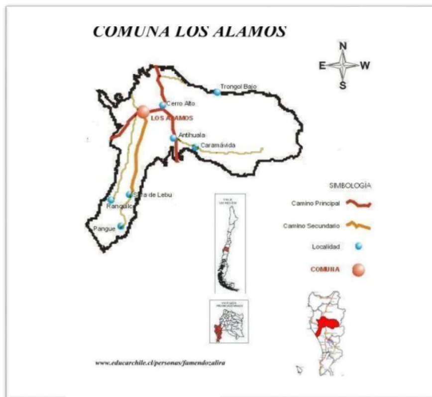
(Figura N° 1: Localización comuna de Los Álamos)

Los Álamos es una de las siete comunas que componen la provincia de Arauco, en la Región del Biobío, se ubica aproximadamente a 116 Km de Concepción, capital regional. Limita al norte con la comuna de Curanilahue, al sur con la comuna de Cañete, al este con las comunas de Curanilahue y Angol (Región de la Araucanía) y al oeste con el Océano Pacífico y la comuna de Lebu.