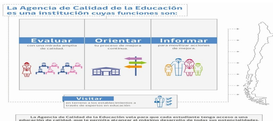
Ilustración 2

La ley estipula que el objeto de la Agencia será evaluar y orientar el sistema educativo para que este propenda al mejoramiento de la calidad y equidad de las oportunidades educativas, es decir, que todo alumno tenga las mismas oportunidades de recibir una educación de calidad. Por ello, dos de sus funciones centrales son evaluar y orientar al sistema educativo para contribuir al mejoramiento de la calidad de las oportunidades educativas.