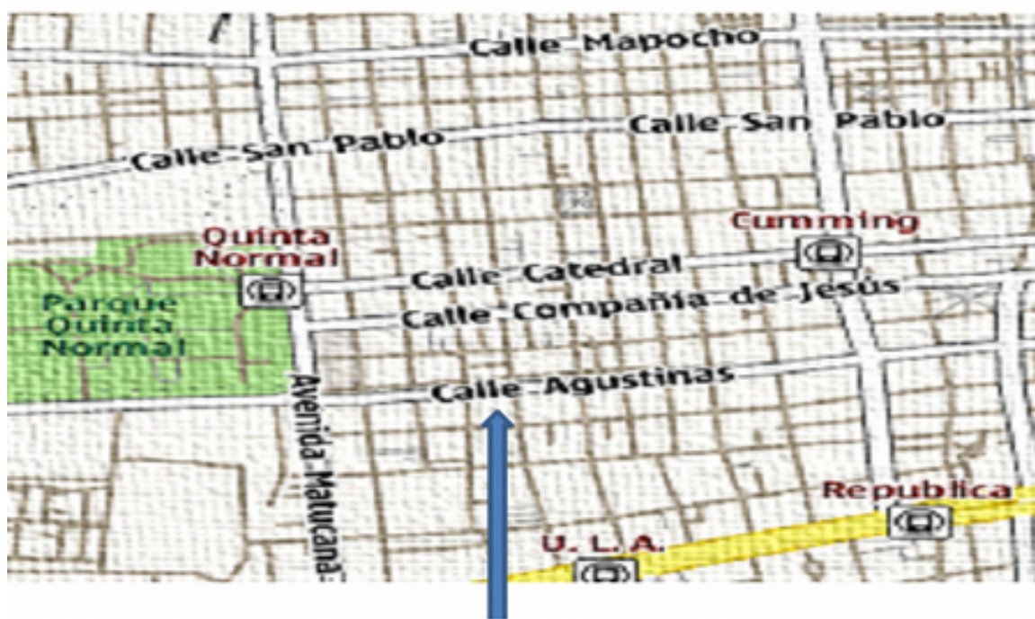
Liceo Miguel Luis Amunátegui