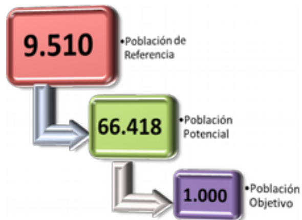
Gráfico N°1: Clasificación de la población área de influencia.

En el siguiente gráfico se establecen los tres niveles de análisis: