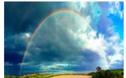
Fotografía de un arcoíris tomada después de una tormenta.

Los hombres y mujeres de todos los tiempos han inventado miles de leyendas para explicar su aparición. La mayor parte de las leyendas interpreta la aparición del arcoíris como la forma que tienen de comunicarse los seres celestiales con la humanidad.